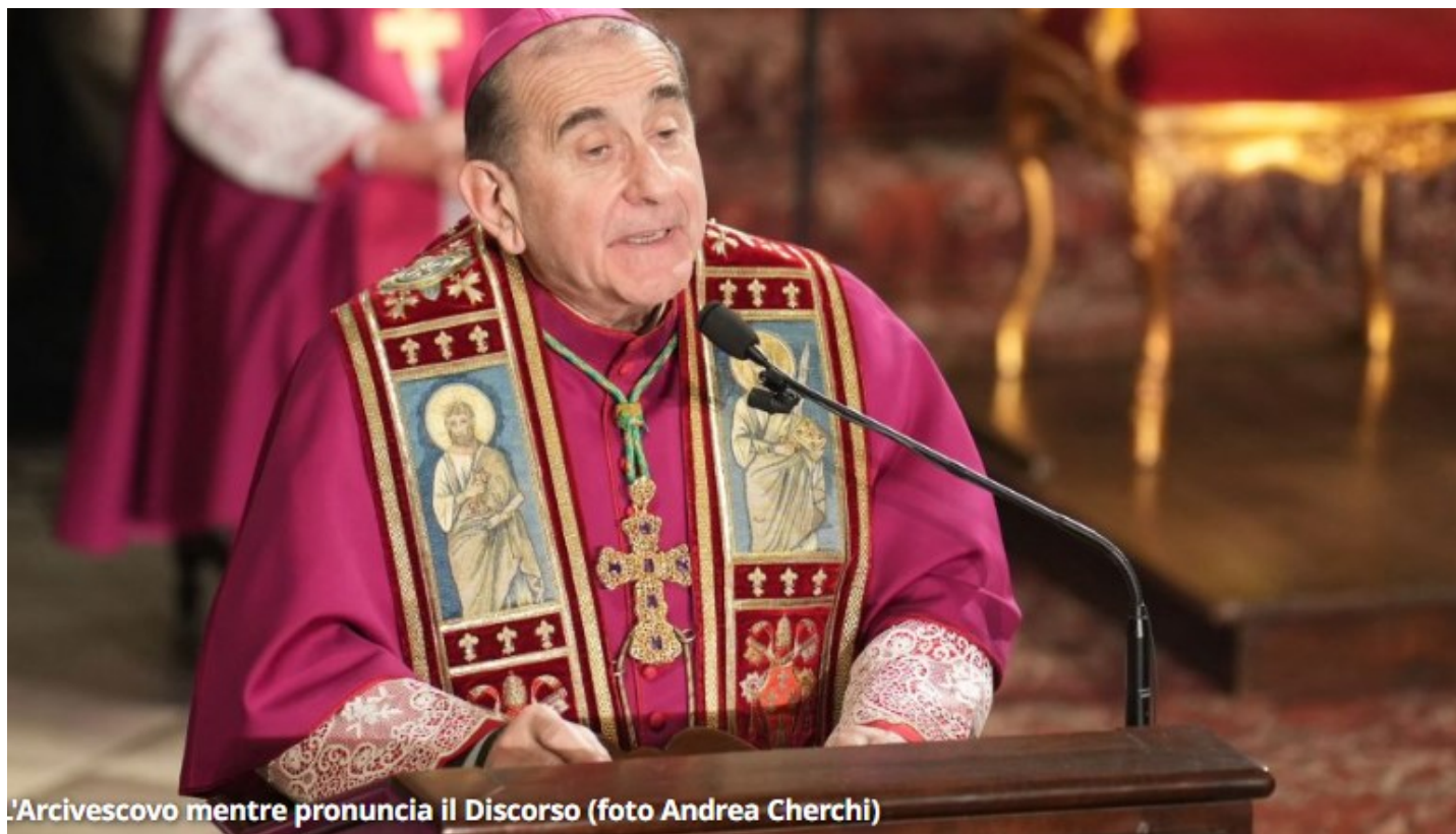
L'Arcivescovo mentre pronuncia il Discorso